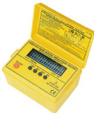
2801IN, 2803IN, 2804IN