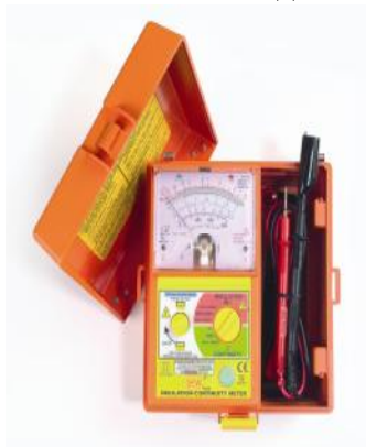
1800IN, 1801IN, 1832IN

Внешний вид измерителей представлен на рисунке 1.