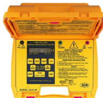
6210IN, 6211IN, 6212IN